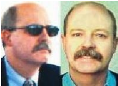
Bivši šef CIA za Balkan Džon Nejbor

Na mesto glavnog koordinatora ovog punkta postavljen je upravo Nejbor koji je pre toga već jednom bio razotkriven kao špijun, i to u Grčkoj 1988. godine, kada su mu tamošnje vlasti otkazale gostoprimstvo. Posao glavnog koordinatora punkta u Skoplju ovaj američki obaveštajac obavljao je do 1996. godine. Posle toga je otišao u Zagreb, gde je imao zadatak da uspostavi kontakte i učvrsti pozicije sa kojih bi mogao bezbedno da se „instalira” u Beogradu.